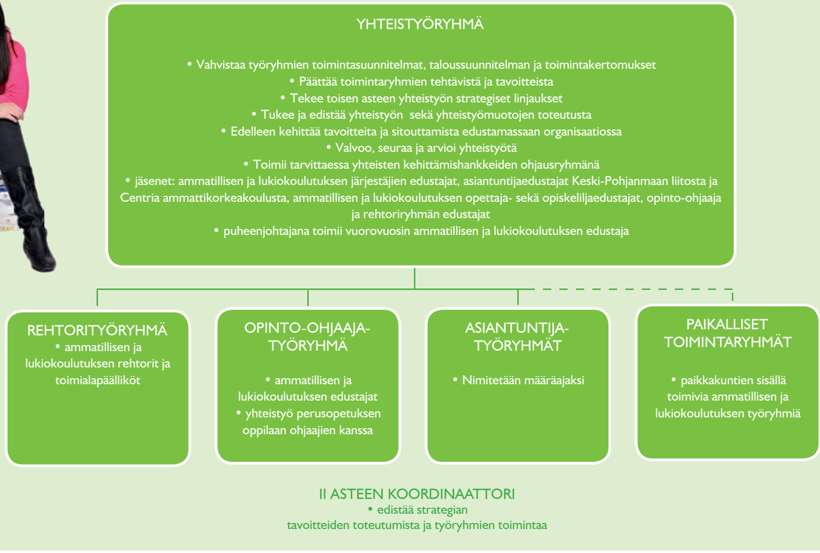
Kuvio 1. Toisen asteen verkoston hallintorakenne